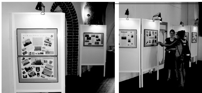
16 großformatige Wandzeitungen zeigen typische Seiten Stralsunds

Seit dem 9. Juni 2006 zeigt die Grundschule „Ferdinand von Schill“ Schülerarbeiten über Stralsund in der Ausstellungsreihe im Wulflamhaus. Zu sehen sind die Arbeiten im Vorraum zum Festsaal täglich von Montag bis Freitag von 8.00 Uhr bis 16.00 Uhr. Schulen der Hansestadt Stralsund, die sich im Rahmen der Ausstellungsreihe ebenfalls präsentieren wollen, können dies mit dem Welterbe-Management Stralsund vereinbaren. Telefon 03831 / 25 23 16