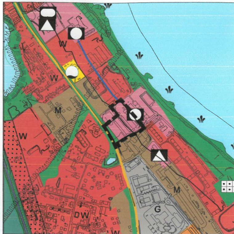
Bisherige Darstellung des seit dem 12.08.1999 rechtswirksamen Flächennutzungsplanes M 1:10 000

PLANZEICHENERKLÄRUNG GEMÄSS PLANZEICHENVERORDNUNG 1990 VOM 18.12.1990